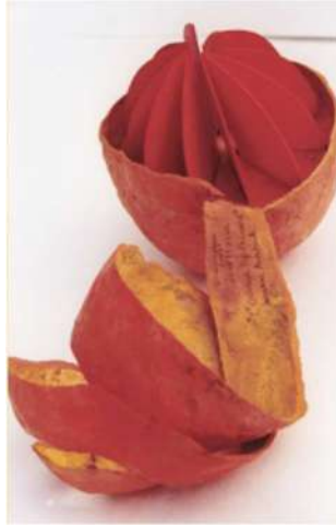
Coco Texède L'orange nyctémère , texte de Suzanne Aurbach, livre unique, 2002