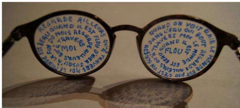
Poème-objet d' Hervé Elouet