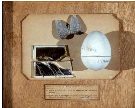
André Breton , Poème-objet , 1935, Edimbourg, Scottish National Gallery of Modern Art